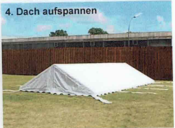
4. Dach aufspannen