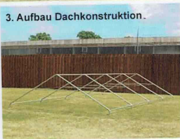
3. Aufbau Dachkonstruktion.