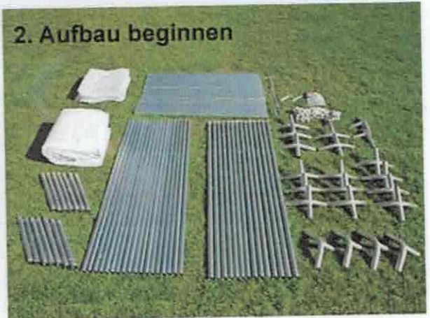
2. Aufbau beginnen