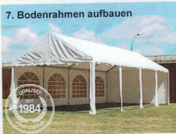
7. Bodenrahmen aufbauen