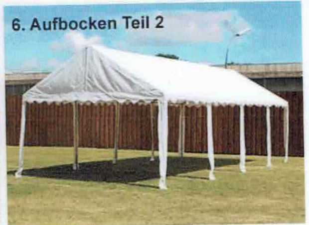
6. Aufbocken Teil 2