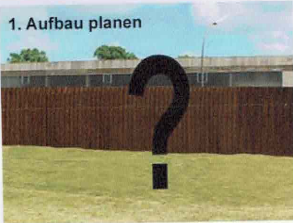
1. Aufbau planen